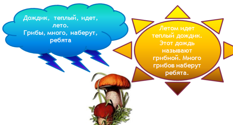
Рис. 2. «Логико-графическая структура по теме «Текст, предложение»

Так, при изучении понятий предложение , текст , учителем может быть составлен кластер для отработки навыков преобразования информации, на основе имеющихся знаний.