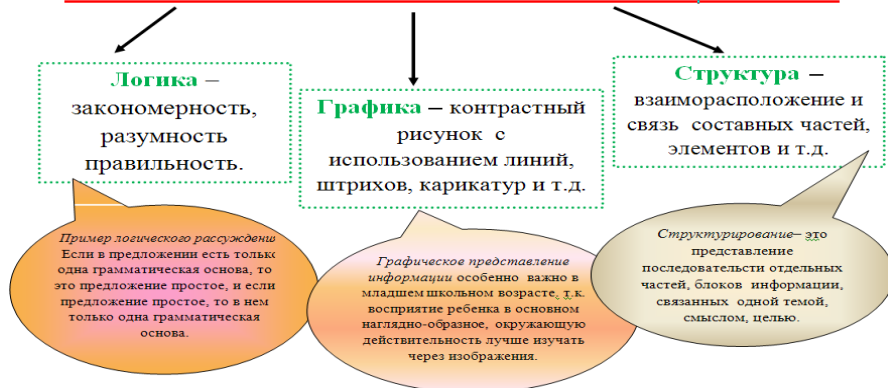
Рис. 1. Схема понятия «Логико-графическое структурирование»

В основе метода лежит использование самостоятельно составленных схем. Схемы достаточно широко распространены в устной и письменной речи. Составление схемы – это творческий процесс, в основе которого стоит образность, т.е. создание образов воспринимаемой информации. Следует заметить, что даже в плохо составленной схеме есть логическая цепочка, которая имеет свою структуру того или иного материала.